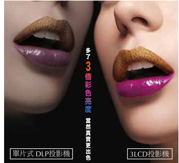
單片式 DLP 投影機

選投影機「彩色亮度」才是關鍵，Epson 3LCD全系列投影機，彩色亮度與同級投影機相差高達3倍，給你3倍真實色彩，讓投影效果更豐富、更飽和。